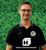
25 URS KAST Fotografie